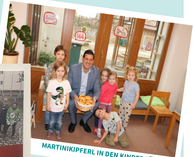
MARTINKIPFERL IN DEN KINDERGÄRTEN