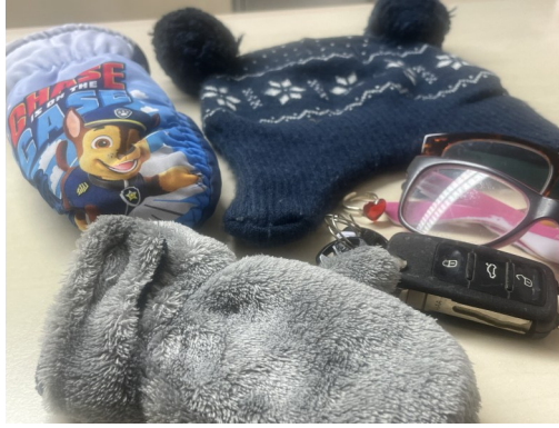
Winterliche Fundstücke, aber auch „Klassiker“ wie Schlüssel, Ringe und Brillen, werden im besten Fall am Fundamt abgegeben – und wiedergefunden.

Beinahe täglich werden verlorene Gegenstände – vom Schlüssel übers Handy bis zum falschen Gebiss – im Fundamt im Bürgerservice abgegeben. Auch Fundgegenstände, die bei der Polizei abgegeben werden, werden im Bürgerservice aufbewahrt. Gerade jetzt in Zeiten großer Menschenmengen beim Advent in der Kellergasse, der Kinderweihnacht oder bei den Punsch- und Glühweinständen, werden vermehrt (Kinder-)Handschuhe (einzeln oder paarweise), Hauben, Schlüssel, Lesebrillen etc. abgegeben. Nachfragen lohnt sich! Falls Sie einen Gegenstand vermissen, melden Sie sich gerne im Bürgerservice (persönlich oder unter 02245/2401) und klären Sie, ob Ihr vermisster Gegenstand abgegeben wurde. Wir hoffen, dass viele Fundgegenstände zu Ihren Besitzer*innen zurückfinden!