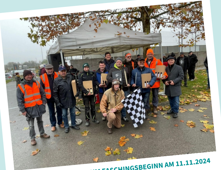
33. TRAKTORRENNEN ZUM FASCHINGSBEGINN AM 11.11.2024