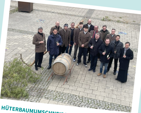
HÜTERBAUMUMSCHNEIDEN AM 10. NOVEMBER