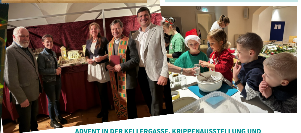
ADVENT IN DER KELLERGASSE, KRIPPENAUSSTELLUNG UND KINDERWEIHNACHT IM SCHLOSS...