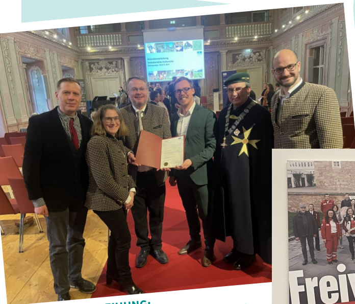
OFFIZIELLE VERLEIHUNG: WOLKERSDÖRFER WINZERBRAUCHTUM ALS IMMATERIELLES KULTURERBE DER UNESCO